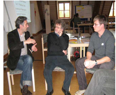
In den Kleingruppen wurde über neue Perspektiven diskutiert.