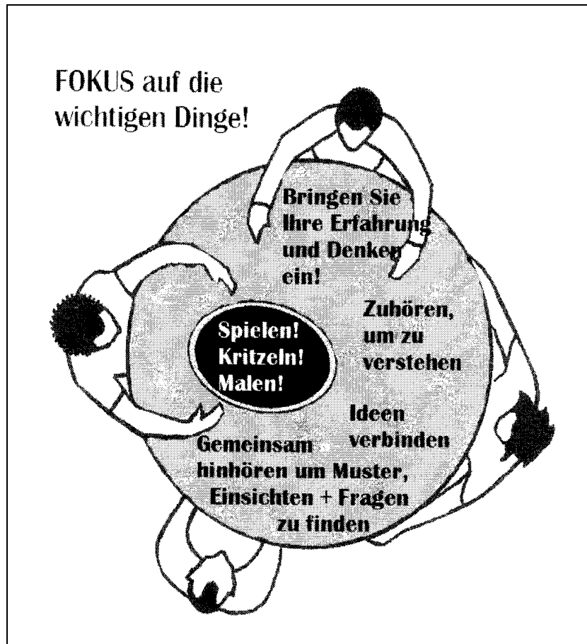
Abbildung 2: Kommunal Café Etikette 2