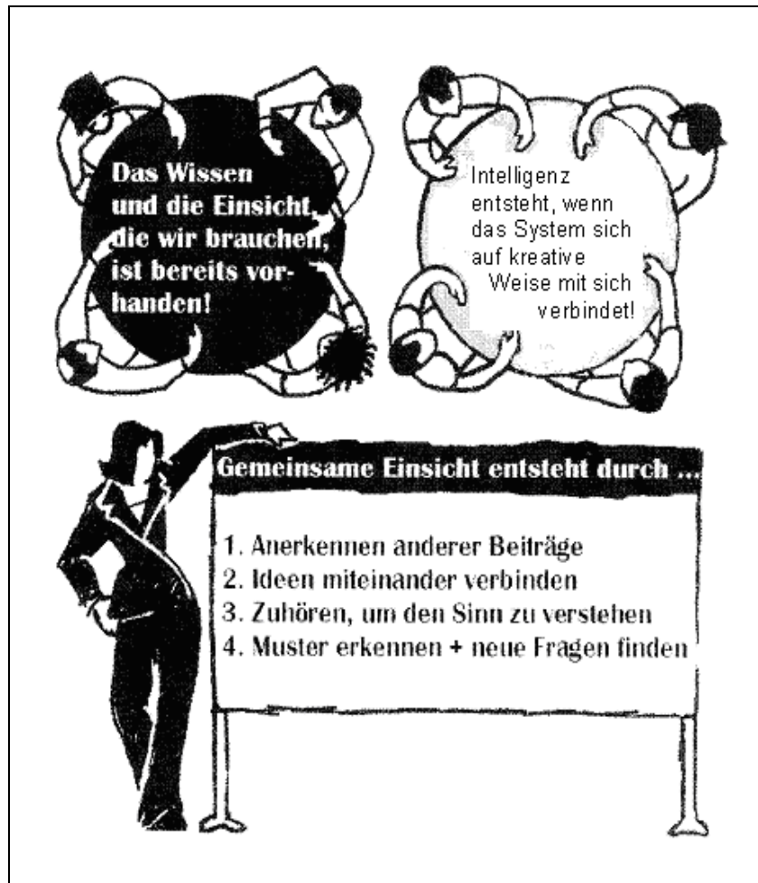
Abbildung 1: Kommunal Café Annahmen 1